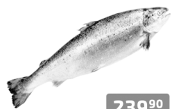
Горбуша с/м, н/р, 1кг