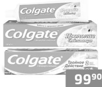
Зубная паста «Colgate»* в ассортименте, 100мл