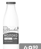
Молоко «Минское» ж2.5%, 950мл