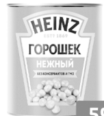
Горошек «Хайнц» консервированный, 400г